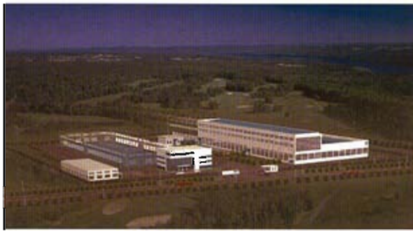
主馆及工厂完成预想图