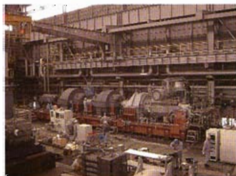
串连试验 (连接功能试验)