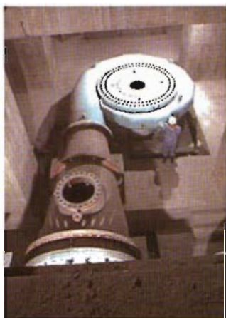
安装中的水泵、出口管